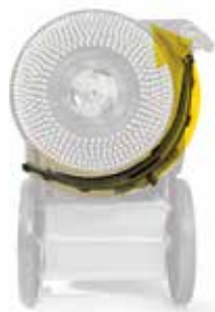
Rotazione nell'altro senso del tergipavimento parabolico