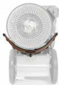
Posizione tergipavimento parabolico a riposo