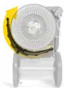
Rotazione del tergipavimento parabolico

L'associazione tra il motore di aspirazione ed il tergipavimento garantisce ottimi risultati di asciugatura.